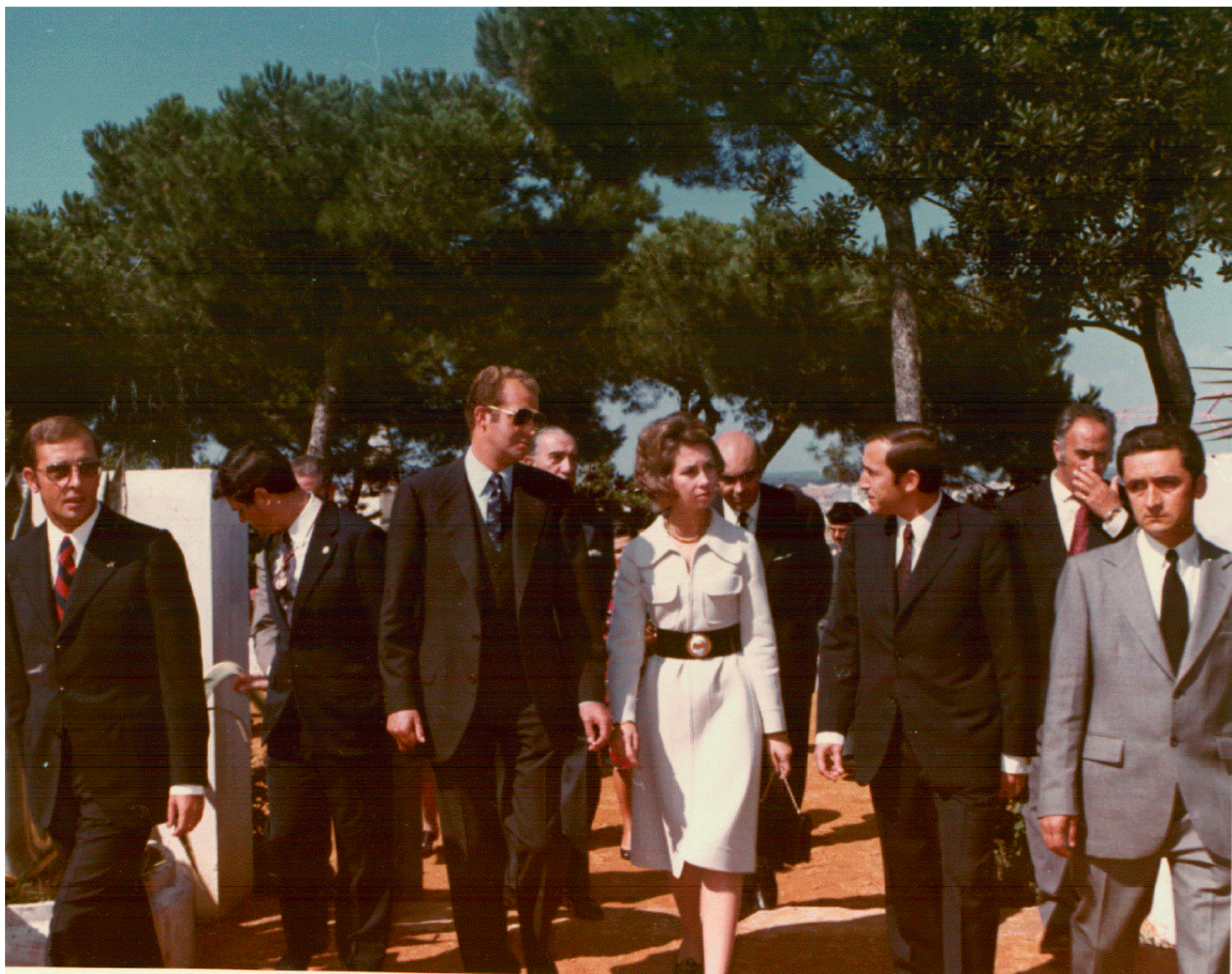
Otra vista del recorrido por el Colegio de los Príncipes don Juan Carlos y doña Sofía.