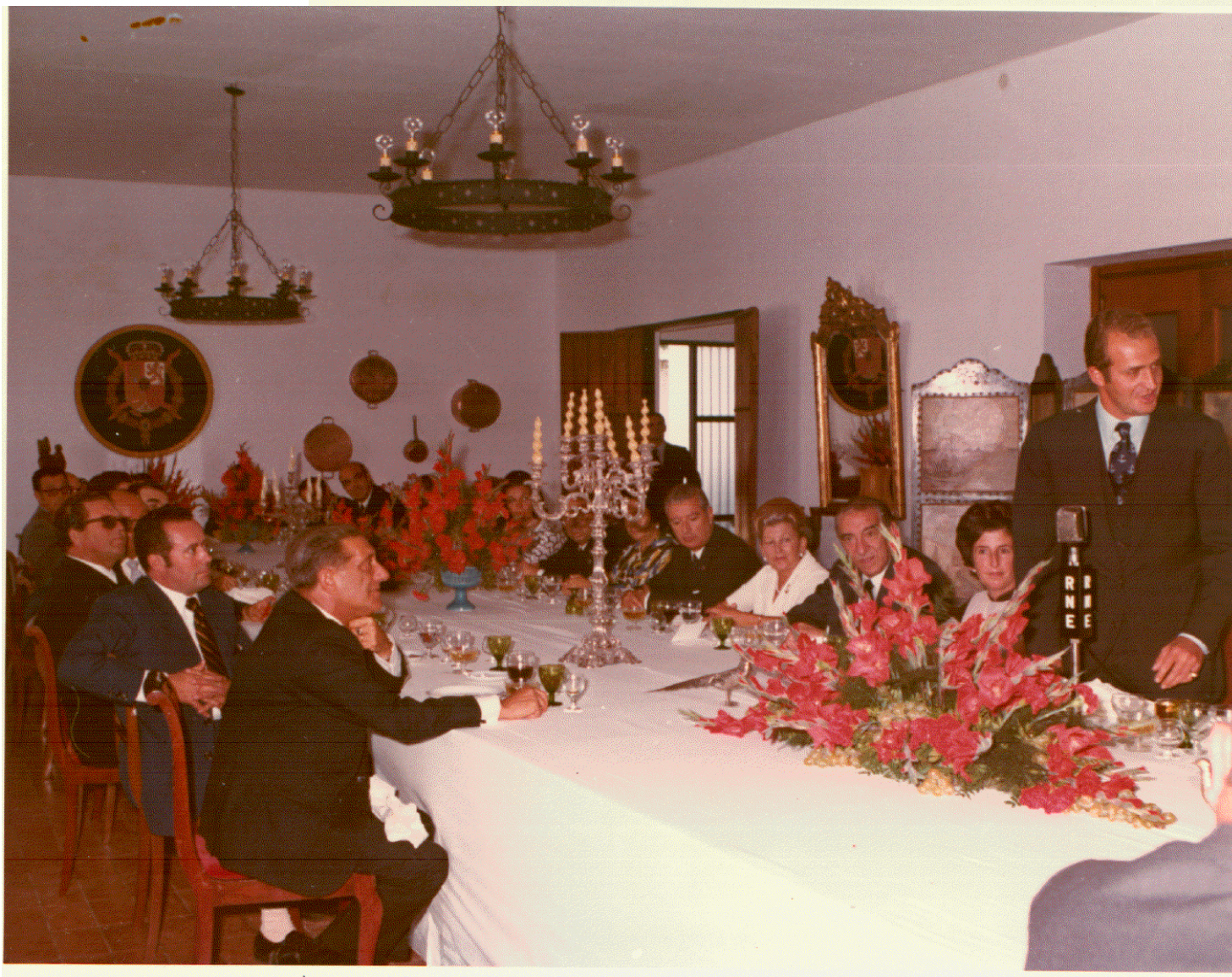
S.A.R. el Príncipe don Juan Carlos dirigiendo unas palabras al término del almuerzo ofrecido por el Ayuntamiento de la ciudad en el comedor de mayores del Colegio, especialmente acondicionado para su celebración.