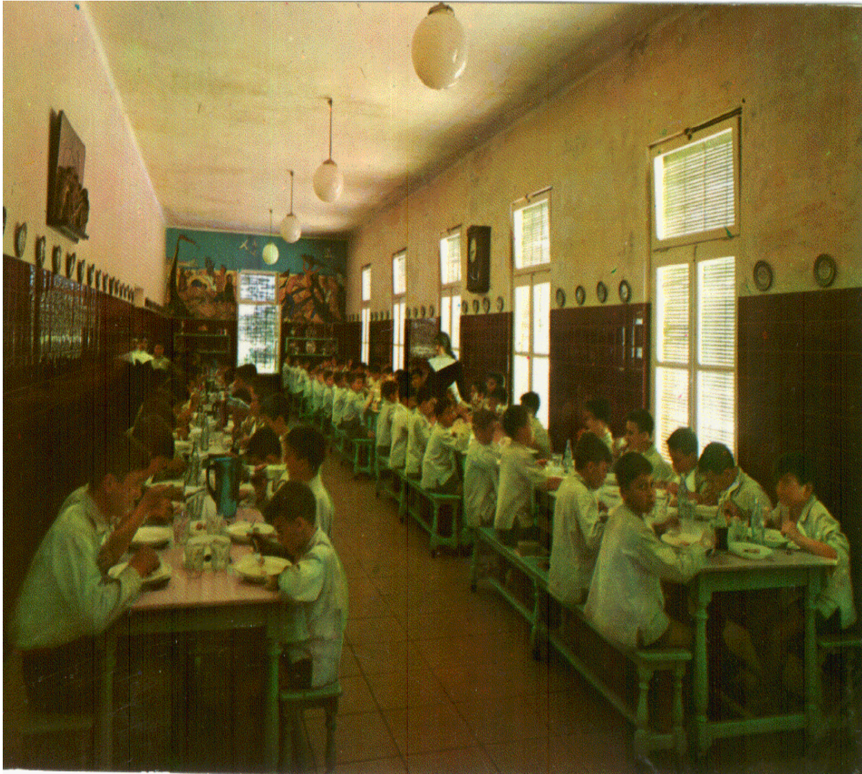
El comedor de los alumnos hacia la mitad de los años 60.