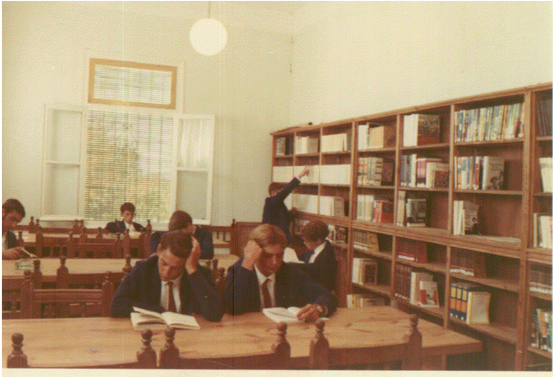
Primitiva biblioteca en la nave que existía en la hoy llamada Plaza de Andalucía, en 1968. Los alumnos visten su uniforme oficial.