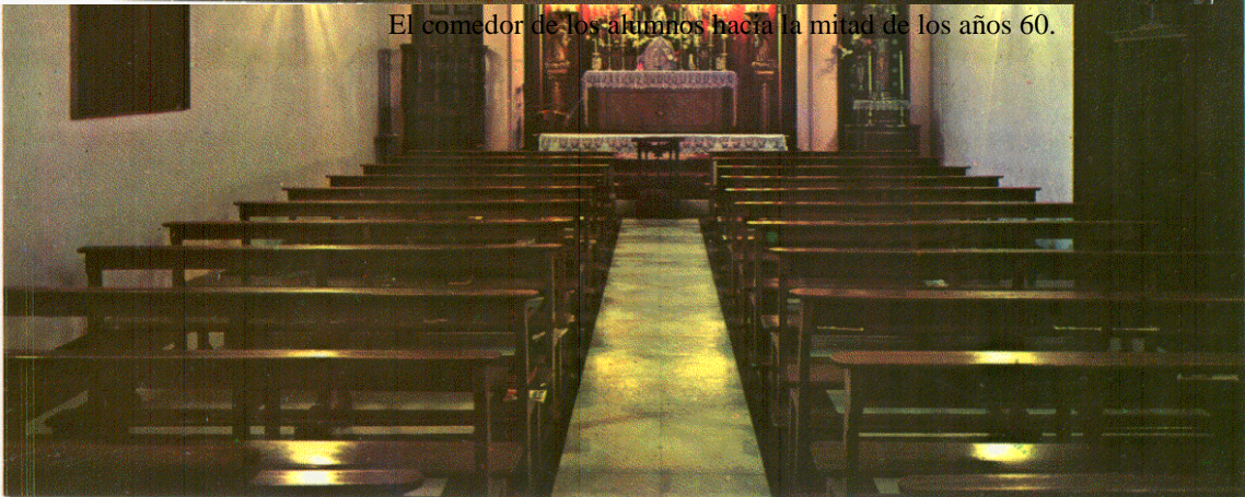
La capilla a comienzos de los años 60. El desplome de un trozo de techo provocó su demolición.