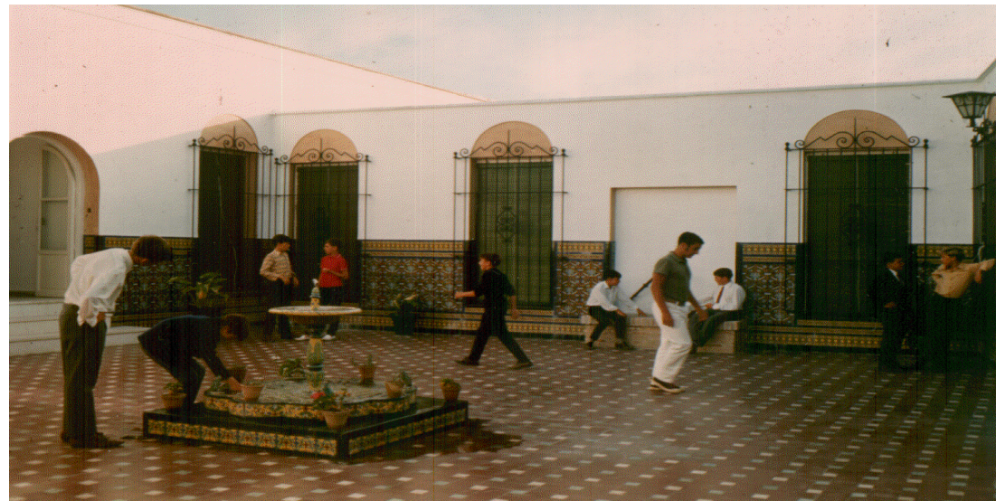
El patio sevillano de la desaparecida Residencia Magallanes.