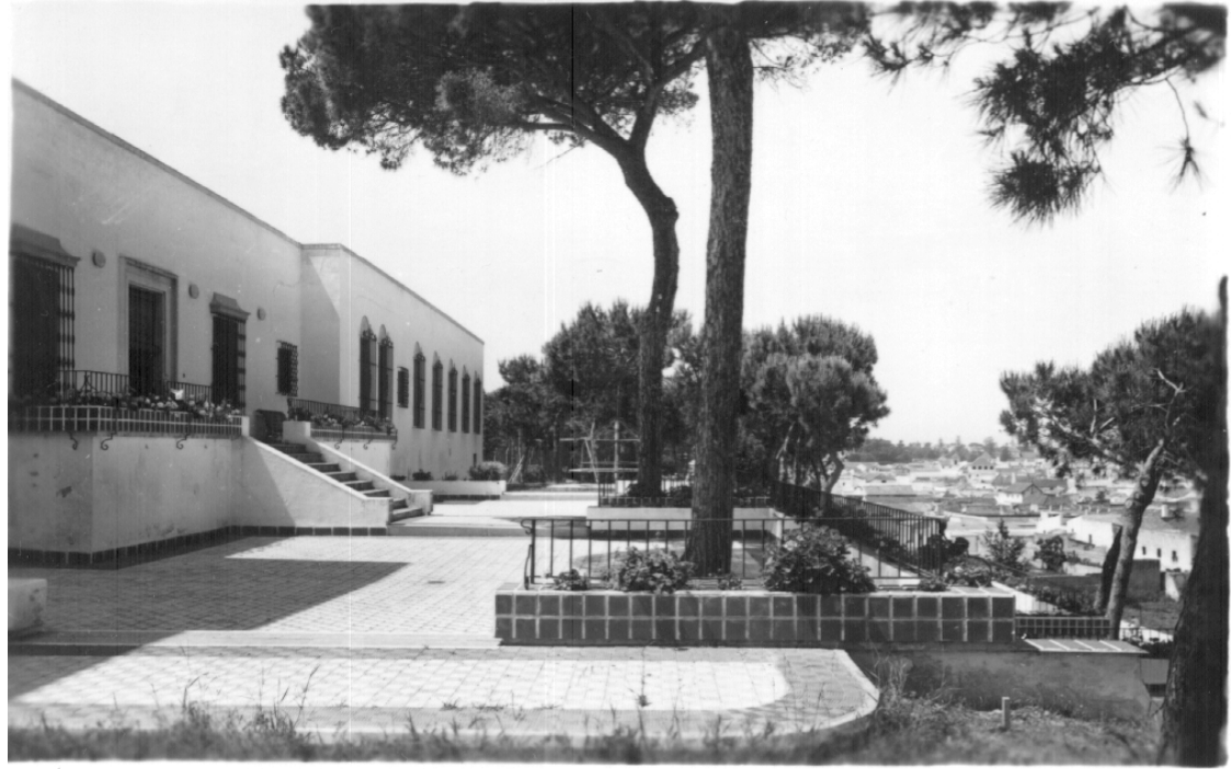
Las marquesinas traseras sobre la barranca que mira al pueblo.