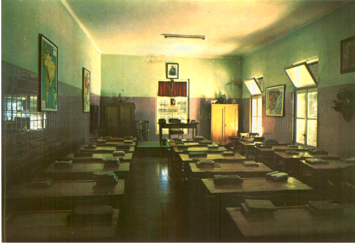
Una espaciosa aula en la primera mitad de los años 60. Solamente existían esta y otras dos más pequeñas.