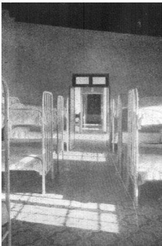
Dormitorios primitivos de los alumnos.