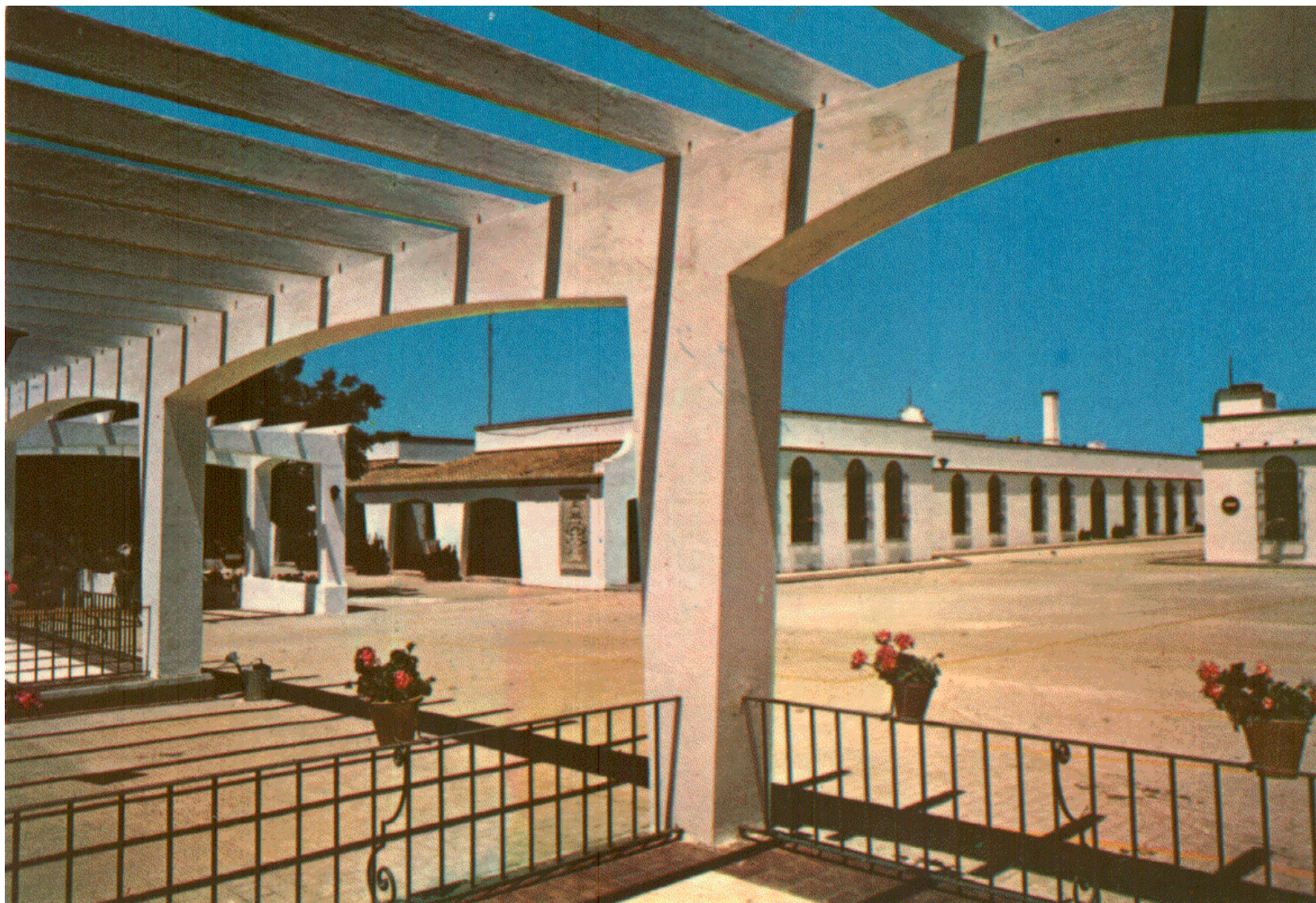
El edificio primitivo, con la pérgola en primer término. Véase el relieve que es motivo del logotipo del Cincuentenario.