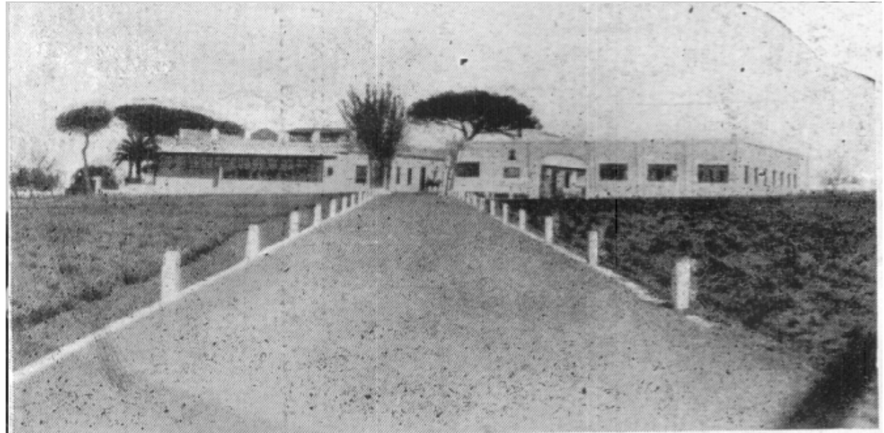
El camino de acceso a las edificaciones en la fecha de la inauguración.