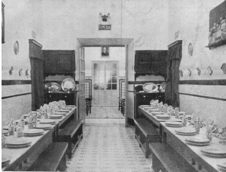
Un aspecto parcial del comedor inicial.