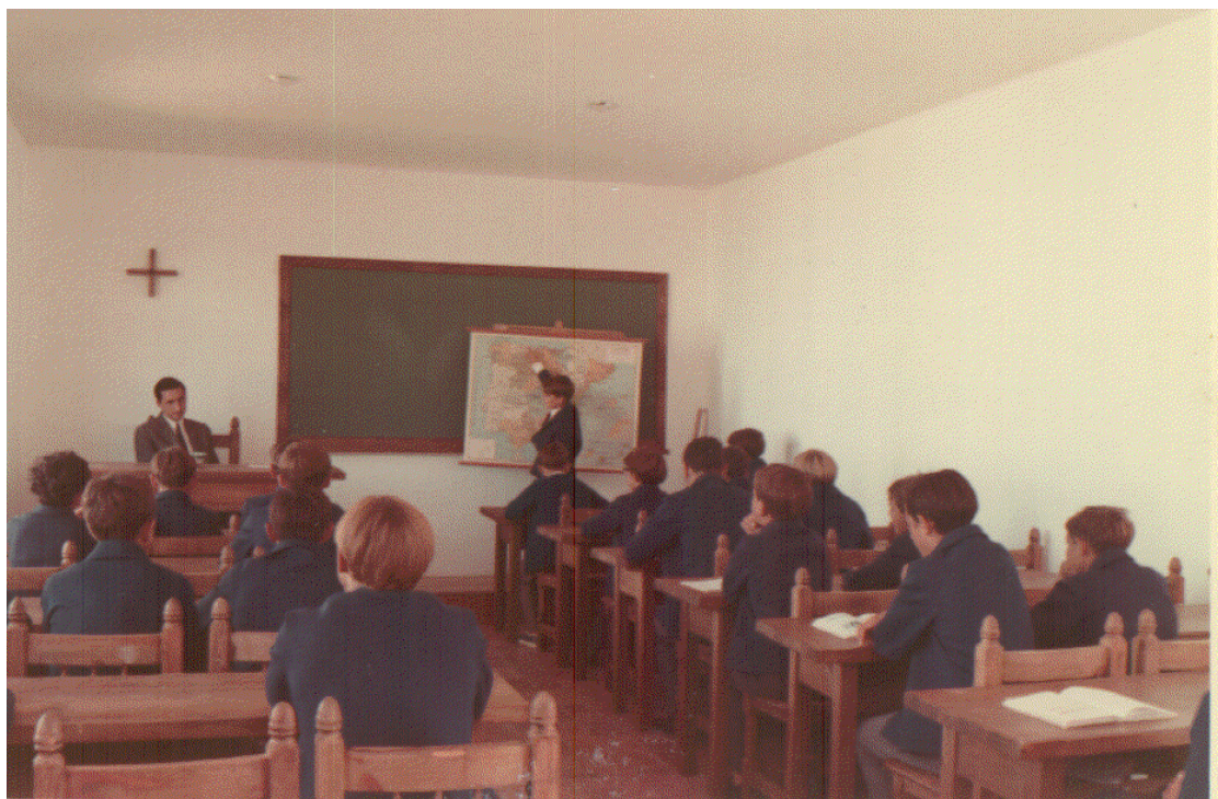
Una de las aulas del llamado Patio de la Rábida, en 1968.