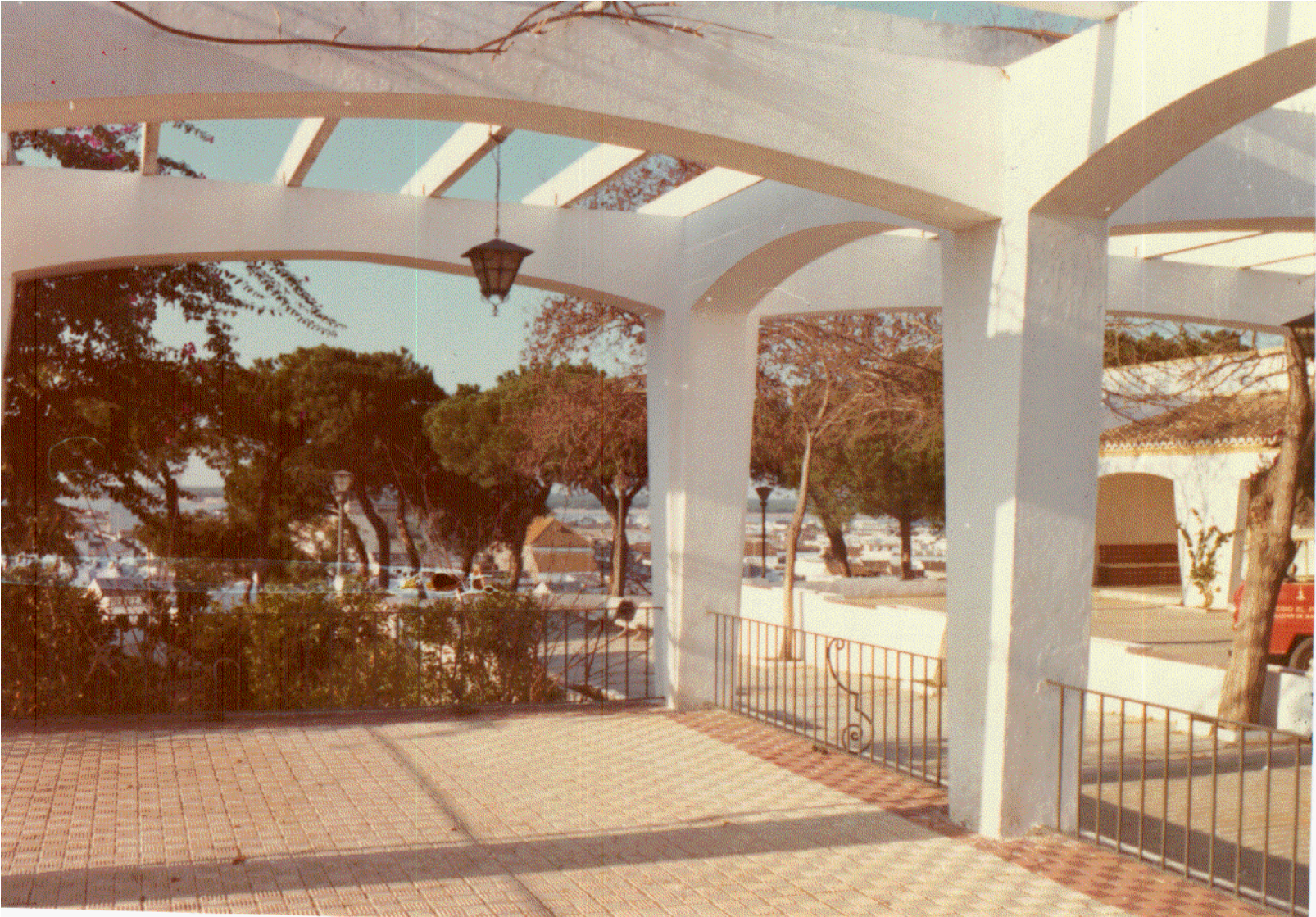
Panorámica de parte del pueblo con el Coto Doñana al fondo, desde la pérgola de acceso, al comienzo de la década de los 70.