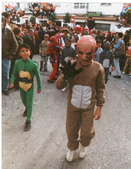
Alumnos del internado desfilando en la cabalgata de carnaval de la localidad.