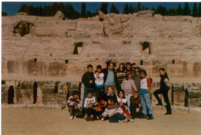
Excursión a Sevilla y visita a las ruinas de la ciudad romana de Itálica (anfiteatro).