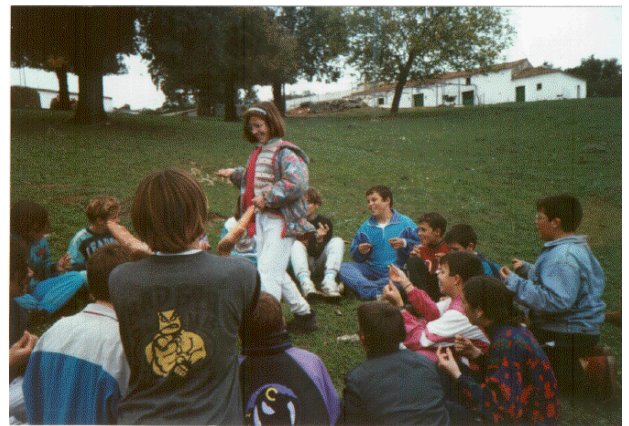
Momento de los juegos y zona donde se realizaban los diversos talleres, que fueron la delicia de los alumnos.