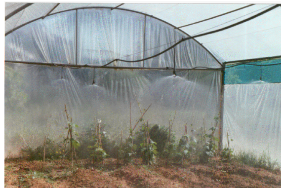
Una zona del invernadero, que también forma parte del club de Medioambiente y centro de cultivo de muchas de las plantas que adornan nuestras instalaciones.