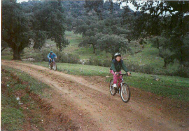
Sierra de Huelva, actividad fuera del Centro para los residentes de lejanía que permanecieron en el mismo esos días. Ciclismo de montaña.