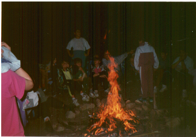
Otro de los momentos convivenciales por excelencia es el fuego de campamento en las noches de acampada.