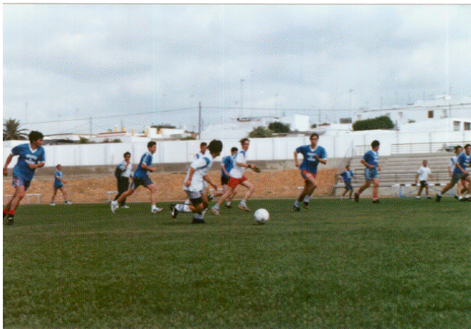
Dentro de la convivencia entre el alumnado, el deporte juega un papel importante como actividad reina y de más aceptación a nivel general.