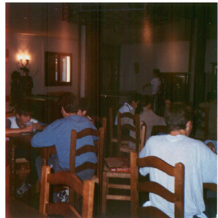
Sala de estar general de los residentes, donde pasan parte de su tiempo de ocio.