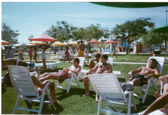
A finales de curso, todos los residentes pasan una tarde en las instalaciones del parque acuático de El Puerto de Santa María.