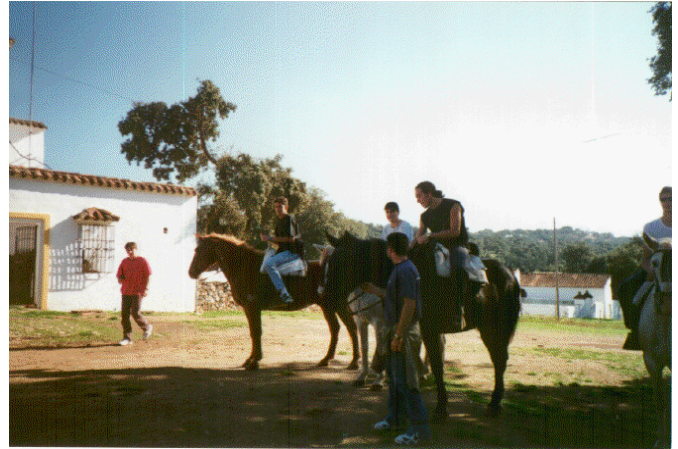
Rutas a caballo, además de otros talleres que completaron una experiencia inolvidable.