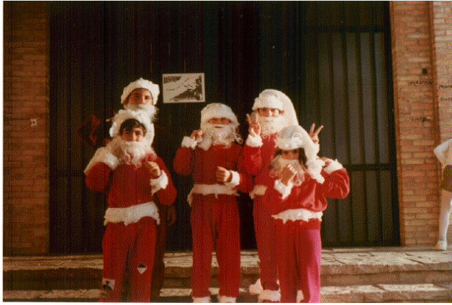
Concurso de villancicos dentro de los actos de conmemoración de la Navidad.