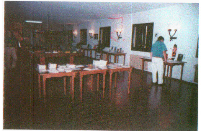
Panorámica de la Exposición del Día de las Letras Gallegas, acto de introducción a unos días de festejos en el internado con actividades en torno a esta celebración.