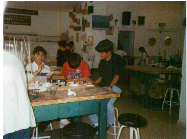
Un momento del desarrollo de la actividad cotidiana en el club de Manualidades.