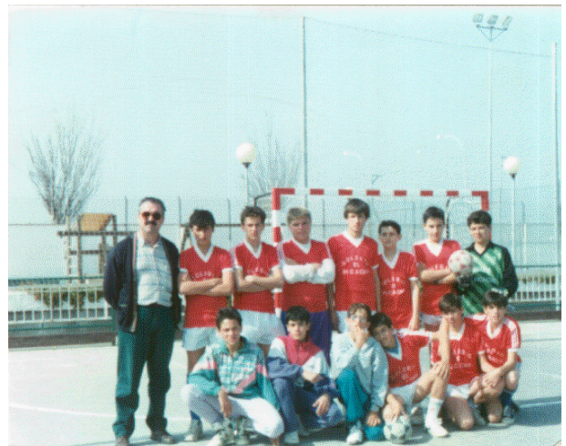
La actividad de futbito ha llevado al internado a ganar numerosos Campeonatos Escolares en varias categorías.