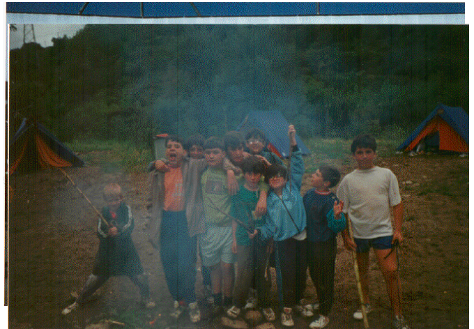
Convivencia en la acampada, basada en la participación y colaboración de todos en todo.