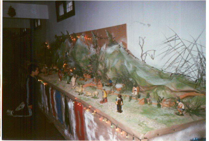
Cuando se acerca la Navidad anualmente se instala el Belén de Residencia, acto que ofrece un ambiente muy entrañable y familiar.