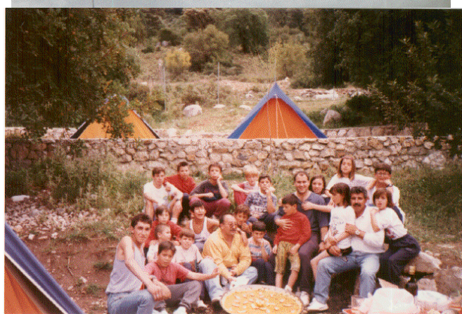
En el sentido de aprendizaje de Cádiz (Benarrábeles) se acompañados por el goce, respeto, competición y convivencia en todos los juegos que se pone al alcance de los residentes en determinada época del año.