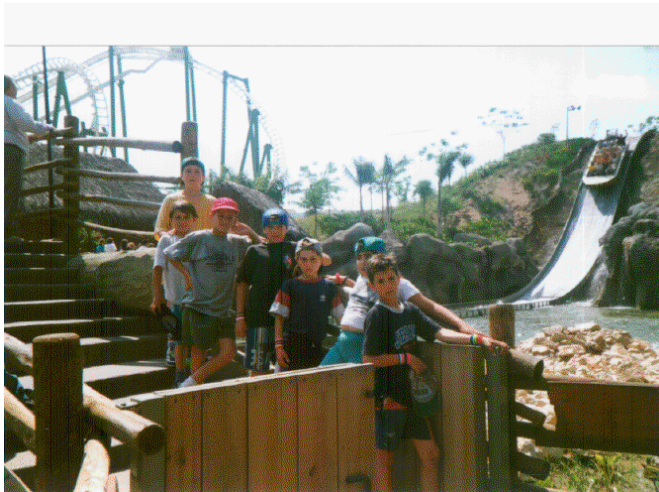
Alumnos residentes del Centro disfrutando de un día en las instalaciones de Isla Mágica (Sevilla).