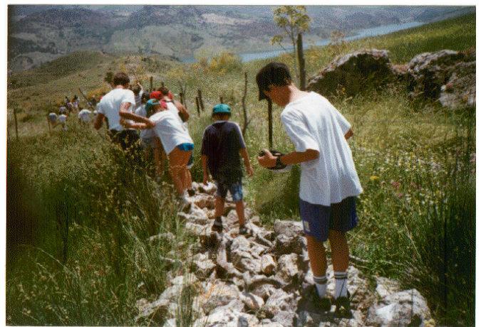
Por las mañanas, las salidas y rutas por la zona constituyen el deleite de todos.