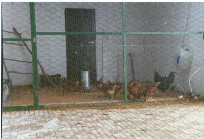
Club de Medioambiente: un aspecto del gallinero.