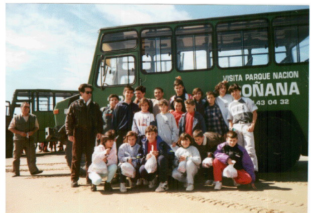
Excursión formativa y del entorno al Coto Doñana, con travesía en el barco, parada en los observatorios de animales y ruta en vehículos por los tres ecosistemas (dunas, matorral y marisma).