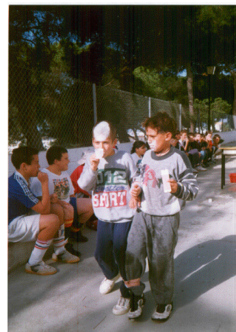
Un momento de otra de las actividades de juegos cooperativos -la ginkana- que se celebran todos los trimestres con gran aceptación por los alumnos.