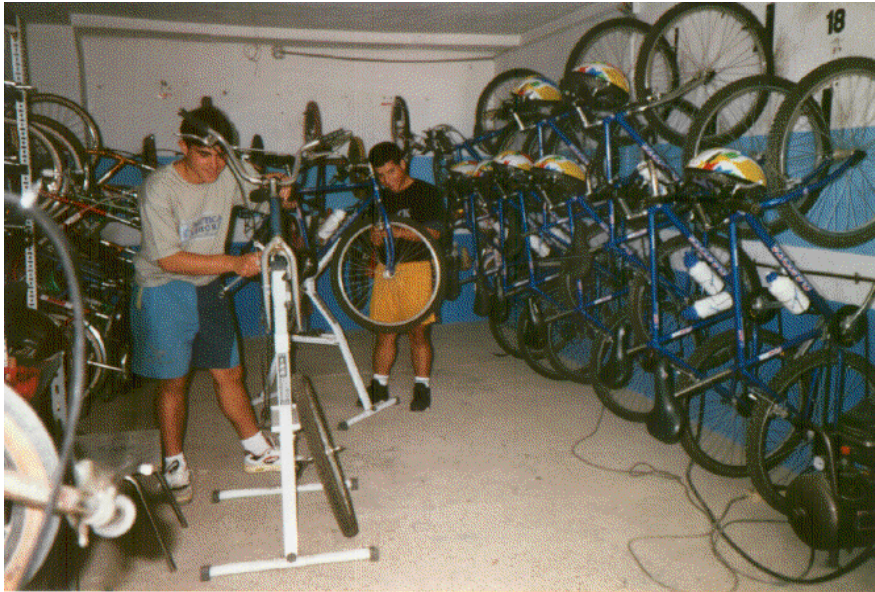
Club de bicicletas, actividad que es la delicia de mayores y pequeños, donde aprenden a reparar, cuidar y manejar la bicicleta, además de disfrutar de su uso.