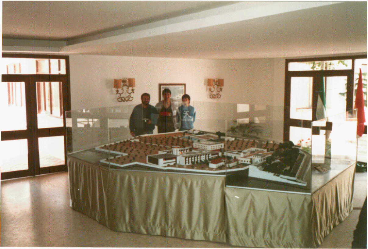
Vista general de la maqueta del Centro, realizada en el club de Manualidades, durante su exposición en la III EXCO, en 1989, y que actualmente se encuentra en una de las dependencias del edificio principal.