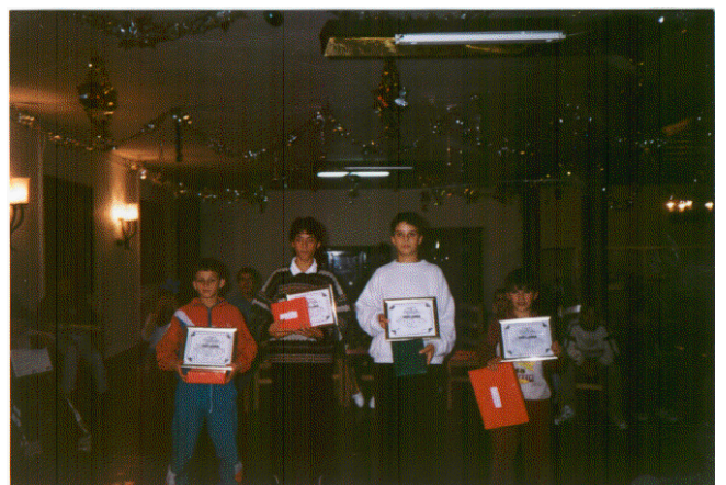
Entrega de premios trimestrales por grupos.