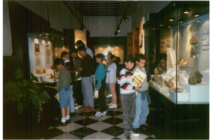
Visita al Museo Arqueológico de Jerez de la Frontera.