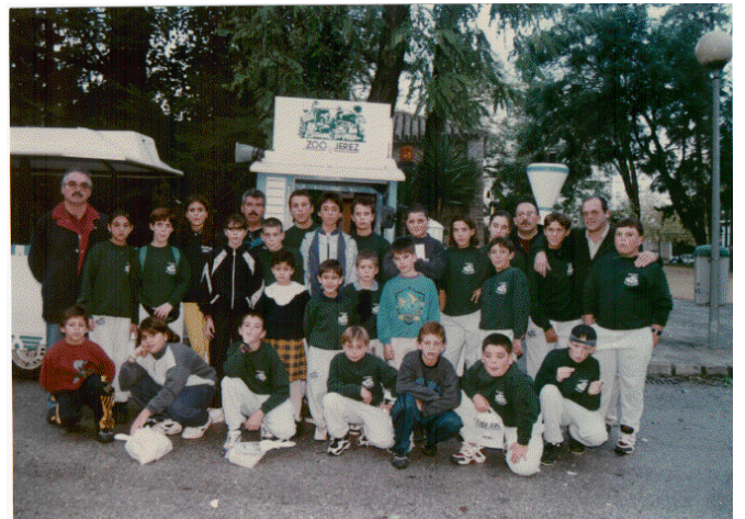
Visita al parque zoológico de Jerez de la Frontera.