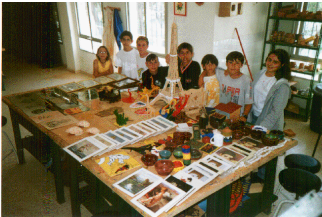
Muestra de una de las exposiciones de los trabajos realizados durante el curso en el club de Manualidades.