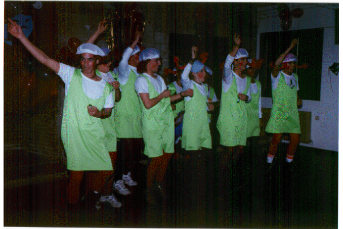
Fiesta con actuación de chirigotas, comparsas, coros, parodias, etc., que proporciona un gran disfrute en la convivencia, no sólo por la realización en sí, sino por la ilusión que depara su preparación.