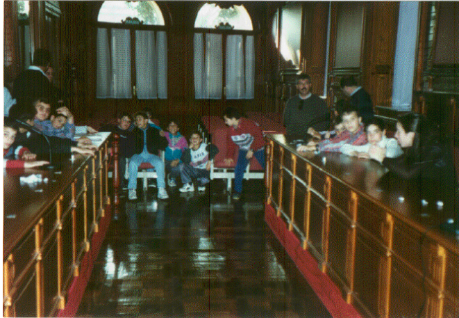
Visita al salón de plenos del Ayuntamiento de la localidad.