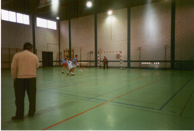
El balonmano, en el que igualmente se han cosechado numerosos campeonatos, y del cual vemos un momento de entrenamiento en el polideportivo cubierto del Centro.