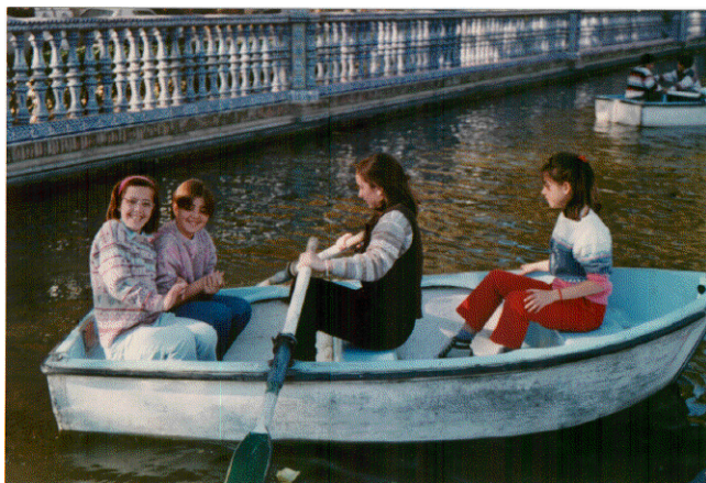
Las primeras alumnas residentes, en excursión a Sevilla (Plaza de España).