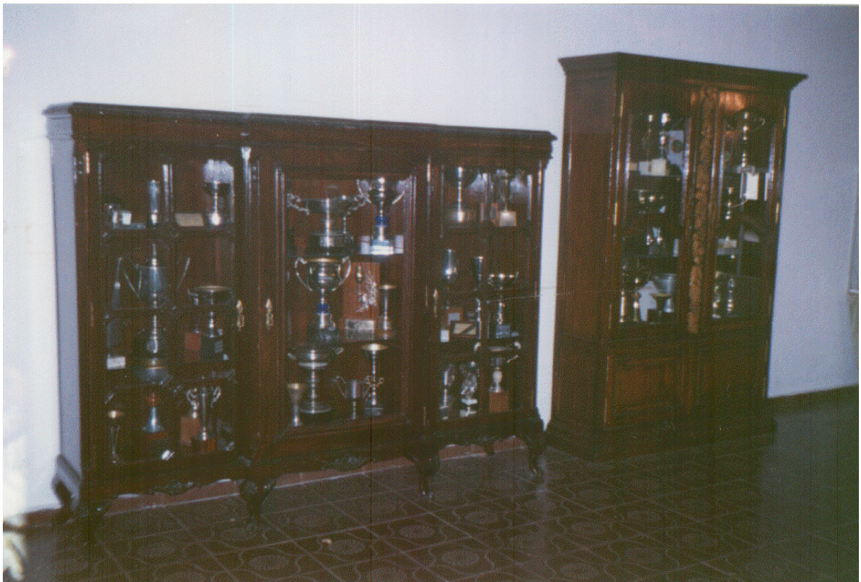
Vitrinas con los numerosos trofeos que se fueron cosechando a lo largo de los años por los alumnos residentes en cada una de las disciplinas deportivas.