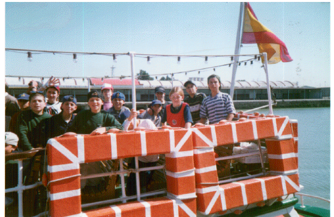
Conociendo los diversos medios de locomoción, viaje desde El Puerto de Santa María a Cádiz en el barco de pasajeros.