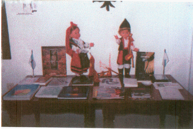
Exposición conmemorativa del Día de las Letras Gallegas.