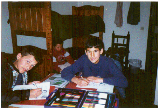
La familiaridad, el trabajo en equipo y el compañerismo están siempre presentes en las relaciones del residente. Momento de la convivencia en habitaciones.