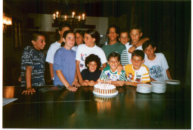
La celebración colectiva de los cumpleaños todos los meses hace reforzar los lazos de compañerismo y familiaridad entre los residentes.