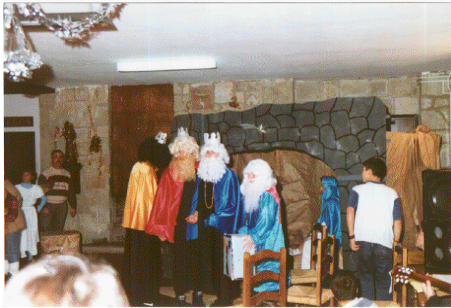
La llegada de los Reyes Magos para los alumnos más pequeños es cada año muy esperada por ellos.