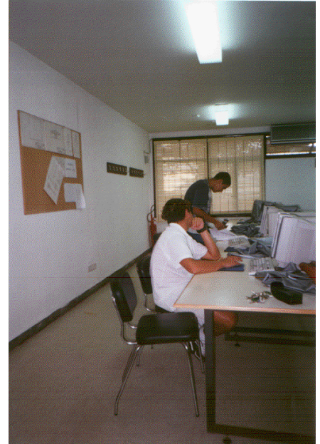
Aula de Informática que va sustituyendo al club de Mecanografía.