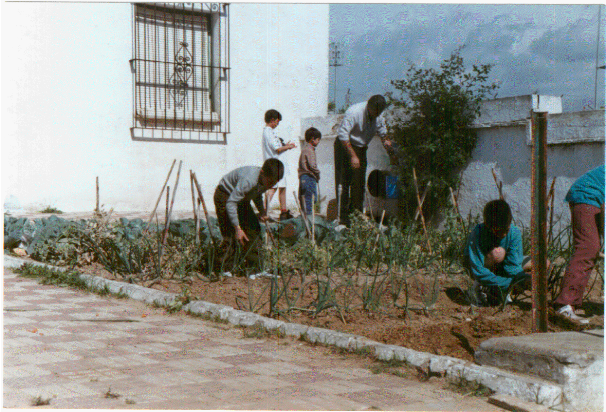
Otro aspecto del club de Medioambiente es el cultivo de distintos productos que luego se consumen en las comidas elaboradas en la cocina del Centro.