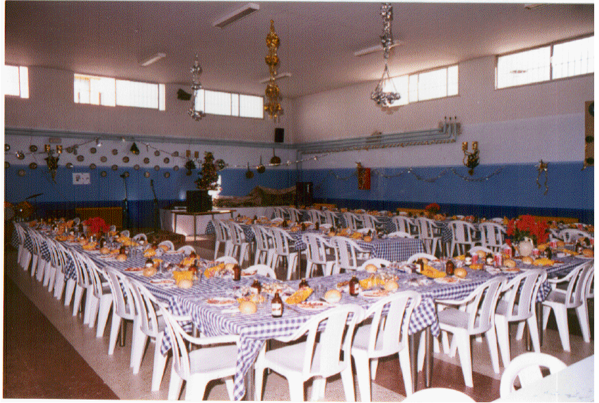
Celebración en el comedor del Centro de la cena de convivencia de Navidad.