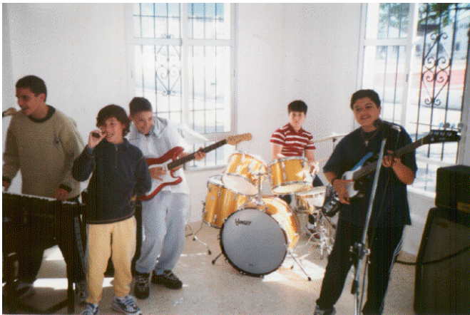
Vista de una parte del club de Música del internado en uno de los momentos de la actividad.