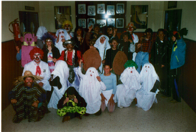
La celebración del carnaval, de enorme raigambre en esta zona de Andalucía y de gran aceptación entre los residentes.