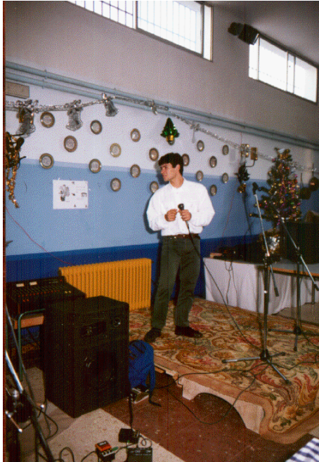
Participación de los alumnos en el fin de fiesta tras la cena de Navidad.