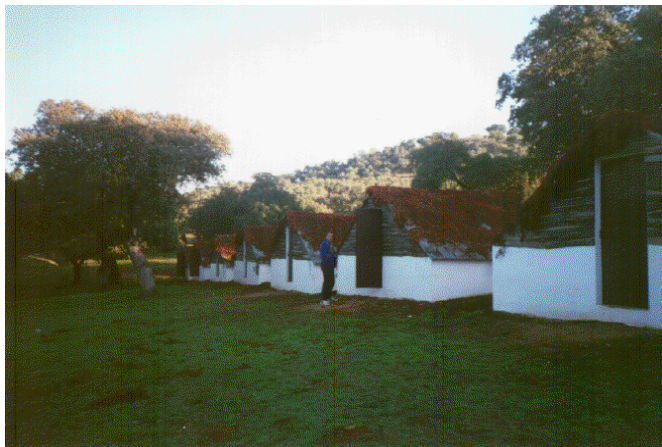
Fin de semana en La Aropía (Aracena-Huelva), en 1996, disfrutando de dos días en la sierra.