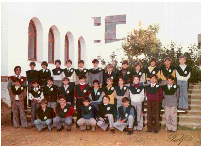
Un curso de E.G.B. con su profesor, tras la imposición de becas.

del Servicio de Fomento Social del citado organismo. Y el 26 de noviembre de 1974 les fueron impuestas las becas con carácter general a todo el profesorado y el alumnado del Centro.