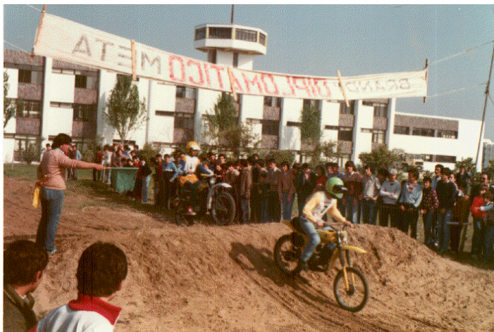
Prueba de motocross.

otros, de un alumno del Centro ganador de numerosas pruebas de esta especialidad a nivel nacional.