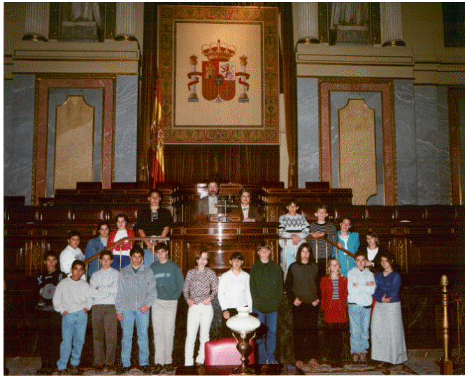
Alumnos de octavo curso de E.G.B. en el Parlamento español.

A partir de entonces, prácticamente todos los años las promociones salientes han realizado un viaje: al año siguiente, con varios coches de profesores y la furgoneta del Colegio y