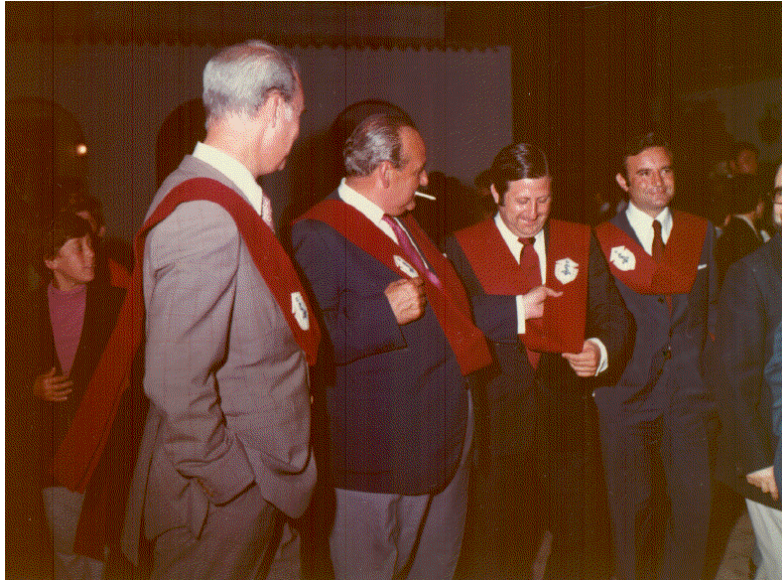
Personalidades distinguidas con la beca en la clausura del curso 1972-73.