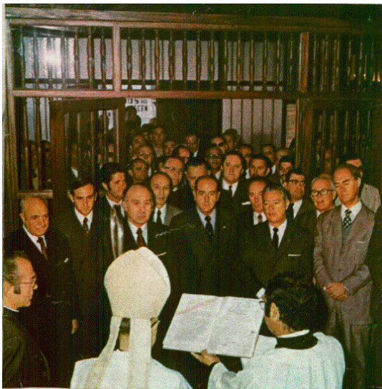
Bendición de la Residencia Elcano.

impusieron las becas de honor a él y a otras personas, como ya hemos referido en su momento, y se pronunciaron los siguientes discursos, que reproducimos del diario “La Voz