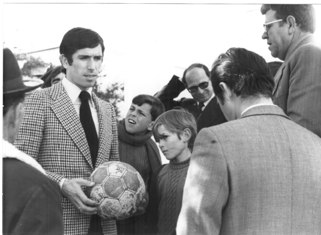
El futbolista Alberto visitando su ex colegio.

Una visita que despertó mucha expectación entre el alumnado fue la realizada en el año 1973 por el entonces famoso futbolista del Atlético de Madrid Alberto. Este fue uno de aquellos primeros alumnos de El Picacho que vivieron la inauguración en 1948, y que aparece entre los fotografiados que figuran en otro lugar de este libro. Con motivo de un desplazamiento de su club a Sevilla para disputar un partido de Liga, se le visitó en su hotel