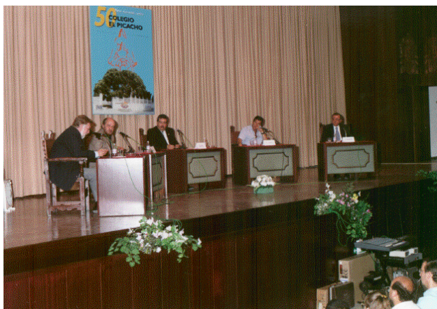
Mesa redonda sobre “El fenómeno Ovni”.

El día 20 de junio se celebró en el salón de actos una mesa redonda sobre “El fenómeno Ovni”, en la que participaron