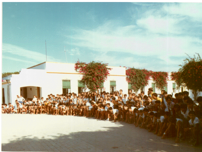
Salida del colegio de un Cross San Lucas.

en competencia con otros centros de Valencia, Ceuta, Jaén y Córdoba, aunque en la siguiente ronda quedó eliminado. En 1973, El Picacho organizó el I Cross San Lucas-Vuelta Pedestre a Sanlúcar, con motivo del día del patrón de la localidad, acontecimiento que mantuvo durante varios años y en el que participaban numerosos