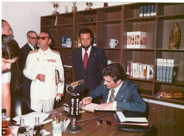
Don Fernando Suárez firma en el Libro de Oro.

Y el 5 de julio de 1975, el vicepresidente tercero del Gobierno y ministro de Trabajo, don Fernando Suárez González, inauguró las nuevas instalaciones construidas para el Centro de Formación Profesional, los edificios de Servicios Generales, aulas y talleres. La “Hoja del Mar” del mes de agosto reflejaba así la visita: “Llegó el vicepresidente tercero acompañado