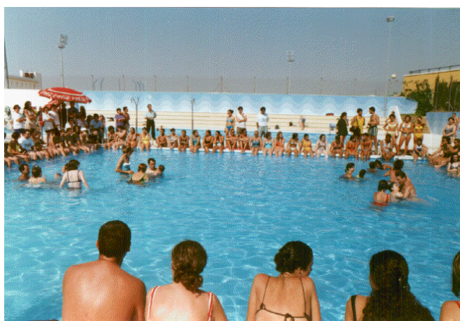
Clase práctica dentro de las Jornadas de Hidroterapia.

Colaboración con el Centro de Estimulación Precoz de la comarca del Bajo Guadalquivir en la celebración de las Jornadas Nacionales de Hidroterapia y Actividad Acuática Adaptada en Parálisis Cerebral, así como con el Ayuntamiento sanluqueño en la realización de los Cursos de Verano de la Universidad Internacional Menéndez Pelayo.