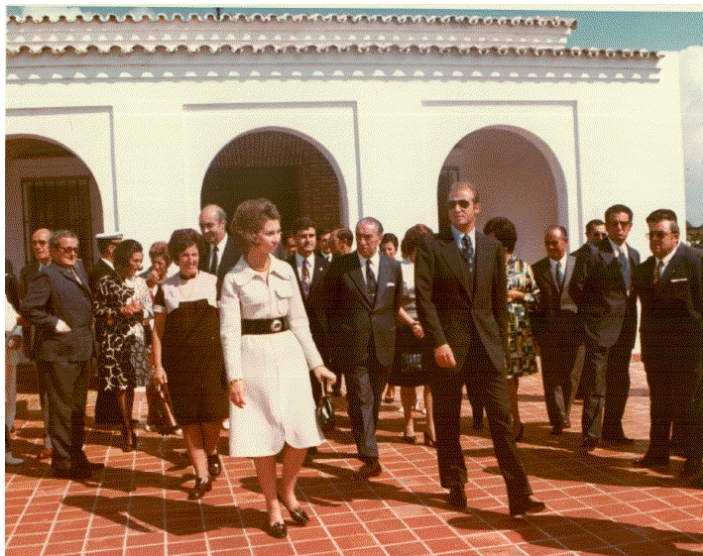
SS.AA.RR. los Príncipes de España, ante el salón de actos-capilla.

lo que el comienzo de curso se demoró ese año hasta primeros de noviembre. Tras un aperitivo servido en la sala de visitas y dependencias anejas del edificio principal, se pasó al