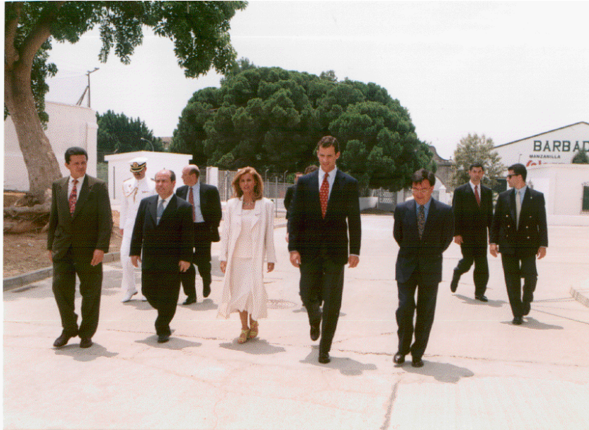
S.A.R. el Príncipe don Felipe en su reciente visita al Colegio.

Y las coincidencias del destino han hecho que veintiséis años más tarde su hijo y heredero, S. A. R. el Príncipe don Felipe de Borbón, repita tal efeméride de forma parecida. Efectivamente, el 10 de julio de 1998 el heredero de la Corona ha celebrado también un almuerzo en El Picacho con diversas autoridades. Tras tomar tierra el helicóptero que lo conducía en el campo de fútbol municipal anejo al Colegio, donde fue recibido por la ministra