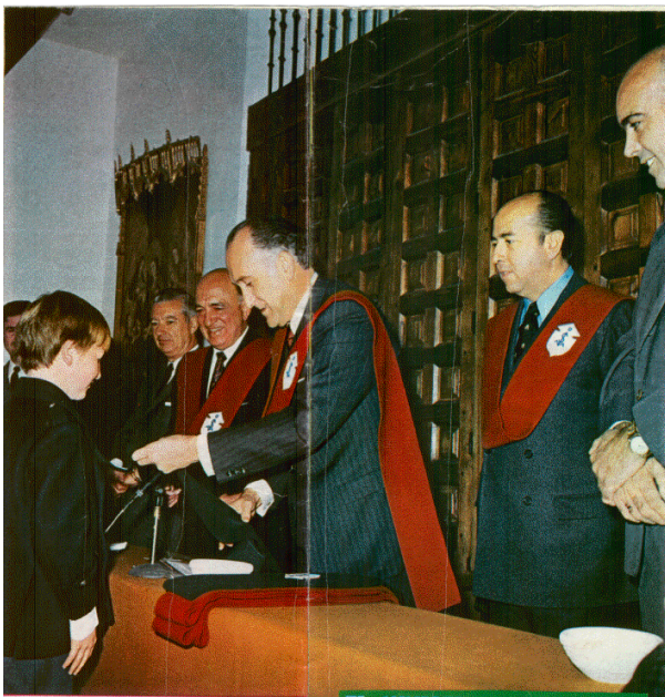
El ministro de Trabajo impone la beca a uno de los alumnos distinguidos.

El Colegio tenía como distintivo una beca, de color verde para los alumnos de E.G.B. y