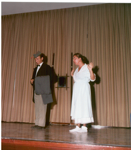
Representación de la obra “¡Ay, Carmela!”

El 16 de julio, y dentro de los actos que se realizaron en la V Concentración de Antiguos