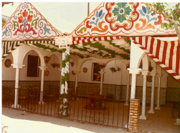
Una preciosa caseta en la Feria de la Manzanilla.

fijas en la cabalgata infantil de las Fiestas de Carnaval de Cádiz, recibiendo su bandera un corbatín conmemorativo cada año que actuaba en ellas. En 1983 desapareció esta actividad.