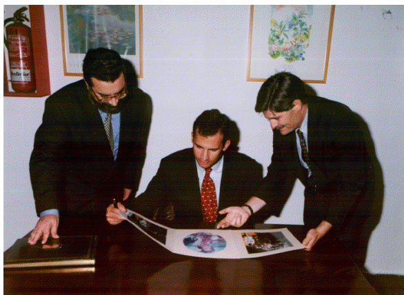
S.A.R. el Príncipe don Felipe recibiendo fotografías de la visita de sus padres al Colegio.