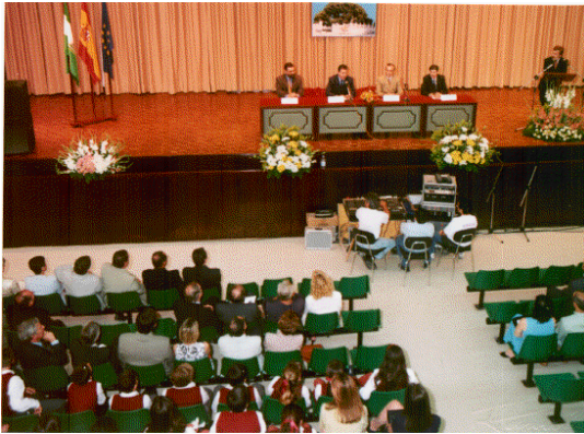
Acto de apertura del Cincuentenario.

Apertura del Cincuentenario, con presentación de los actos conmemorativos y del cartel