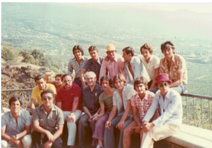
Grupo de alumnos de sexto curso de bachillerato, con el valle de La Orotava al fondo.