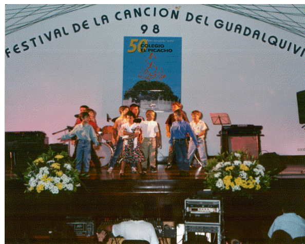
Festival de la Canción del Cincuentenario.

conjunto de viento de Juventudes Musicales de Sanlúcar. Por la noche tuvo lugar el Festival de la Canción del Guadalquivir, protagonizado por los alumnos y alumnas del Centro.