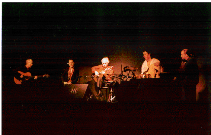
Concierto de Manolo Sanlúcar.

Esperemos que en el año 2048 se celebre el Centenario del Colegio El Picacho y esta obra se vea completada con el relato de los segundos cincuenta años de vida del mismo.