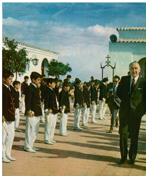
El ministro De la Fuente ante la banda de cornetas y tambores.

...Don Licinio de la Fuente pronunció un discurso en el que, entre otras cosas, dijo: “Esta Residencia, como otras que ya son espléndida realidad en nuestras costas, tiene un objetivo entrañable: no disminuir ni un ápice la igualdad de oportunidades ante la vida a los hijos de quienes la dieron por su Patria de la manera más noble, en su puesto de trabajo... El Instituto Social de la Marina, con enorme sensibilidad, sigue atendiendo a los problemas sociales más urgentes, haciéndose eco de las necesidades que vienen cubriendo residencias como esta, en un magnífico exponente de una avanzada práctica social. Vosotros -dijo, dirigiéndose a los alumnos residentes- sois juventud de España y España no os olvida nunca porque sois la mejor garantía de su futuro. Yo sólo quiero pedir os lo que os piden también vuestros profesores, lo que nos pide España a todos: trabajo. Porque nada honra tanto al hombre, nada le ennoblece y dignifica como el trabajo, lo mismo que ennobleció para siempre a vuestros padres, en cuyo nombre España os pone en el camino de que os desarrolléis intelectual y físicamente, para que continuéis trayectorias vitales y las hagáis realidad fecunda. A vuestra disposición están los medios precisos. Yo sé que no vais a decepcionarnos, no vais a decepcionar a España ni a la digna memoria de